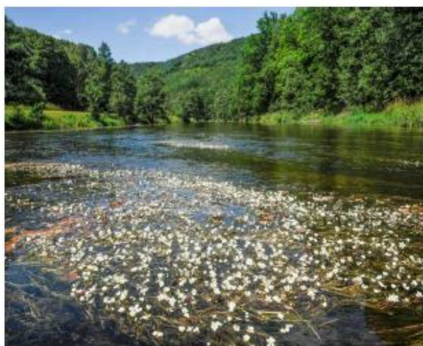
Kamp mit Unterwasservegetation mit Flutendem Hahnenfuß

Natura 2000 ist das weltweit größte Schutzgebietsnetzwerk mit mehr als 27.000 Schutzgebieten in ganz Europa! Diese 36 Schutzgebiete werden in Niederösterreich Europaschutzgebiete genannt und decken etwa 23 Prozent der Landesfläche ab. Sie dienen der Erhaltung europaweit geschützter Arten und Lebensräume. Grundlage für Europaschutzgebiete bilden die Fauna-Flora-Habitat- und die Vogelschutz-Richtlinie, die zur Sicherung der biologischen Vielfalt dienen. Ein Europaschutzgebiet ist keine Sperrzone. Eine naturverträgliche Bewirtschaftung, die in der Vergangenheit dazu geführt hat, dass schützenswerte Lebensräume entstanden sind, ist daher nicht nur gestattet, sondern sogar erwünscht.