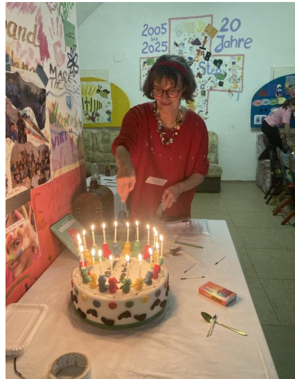
Die bunte Step-Torte wurde zur Jause verteilt.