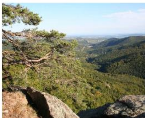
Blick vom Heimlichen Gericht übers Kremstal

Charakterisiert wird das Schutzgebiet durch die tief in die Böhmisches Masse eingeschnittenen Flusstäler des Kamps und der Krens mit teils noch unregulierten Flussabschnitten, die wertvollen Lebensraum für