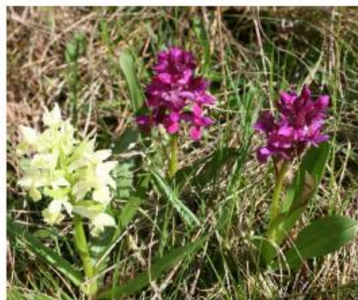
Holunderknabenkraut auf Trockenrasen im Kremstal

bedrohte Unterwasservegetation, Vögel, Fische, Reptilien und Amphibien bieten.